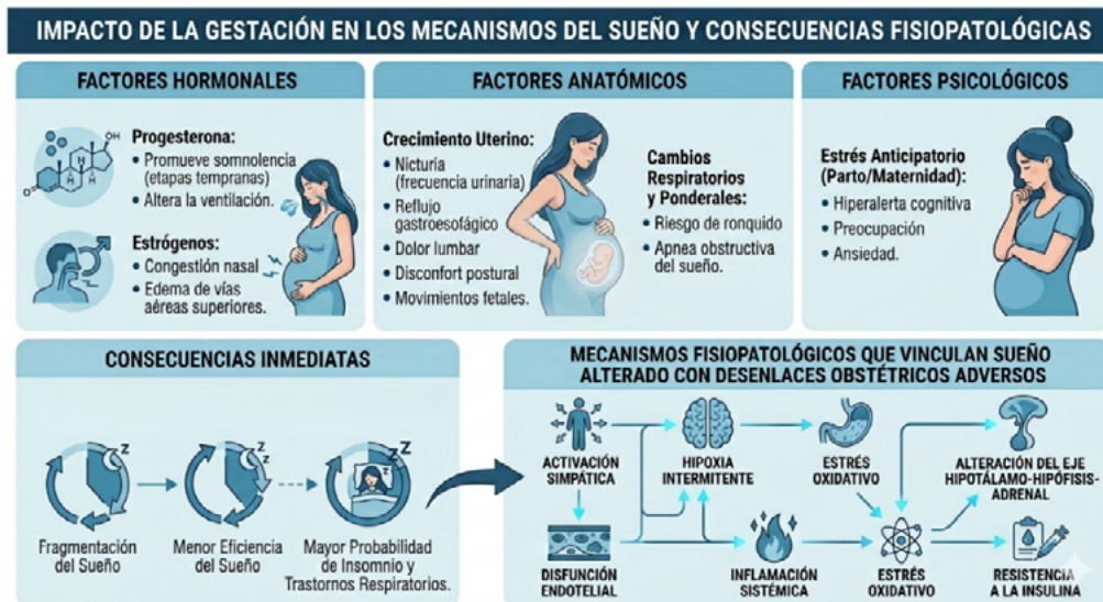
Figura 2. Efectos fisiológicos de la gestación sobre el sueño y mecanismos fisiopatológicos de los trastornos del sueño en la madre-producto. Elaboración propia con gemini.google.com