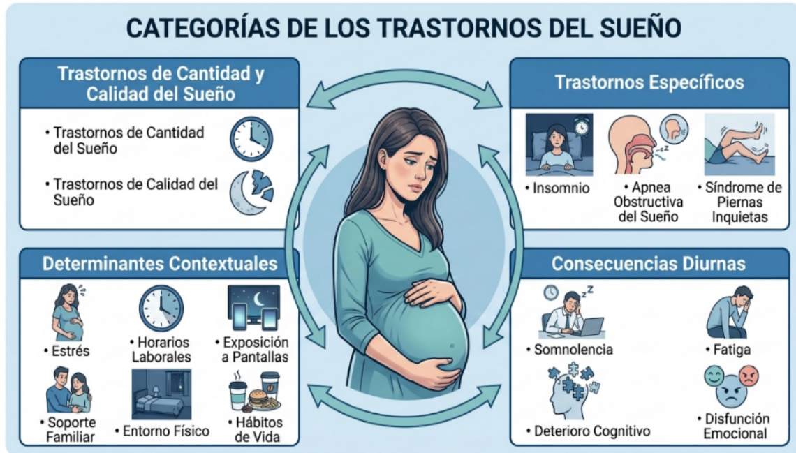
Figura 1. Clasificación clínica de los trastornos del sueño durante la gestación. Elaboración propia con gemini.google.com